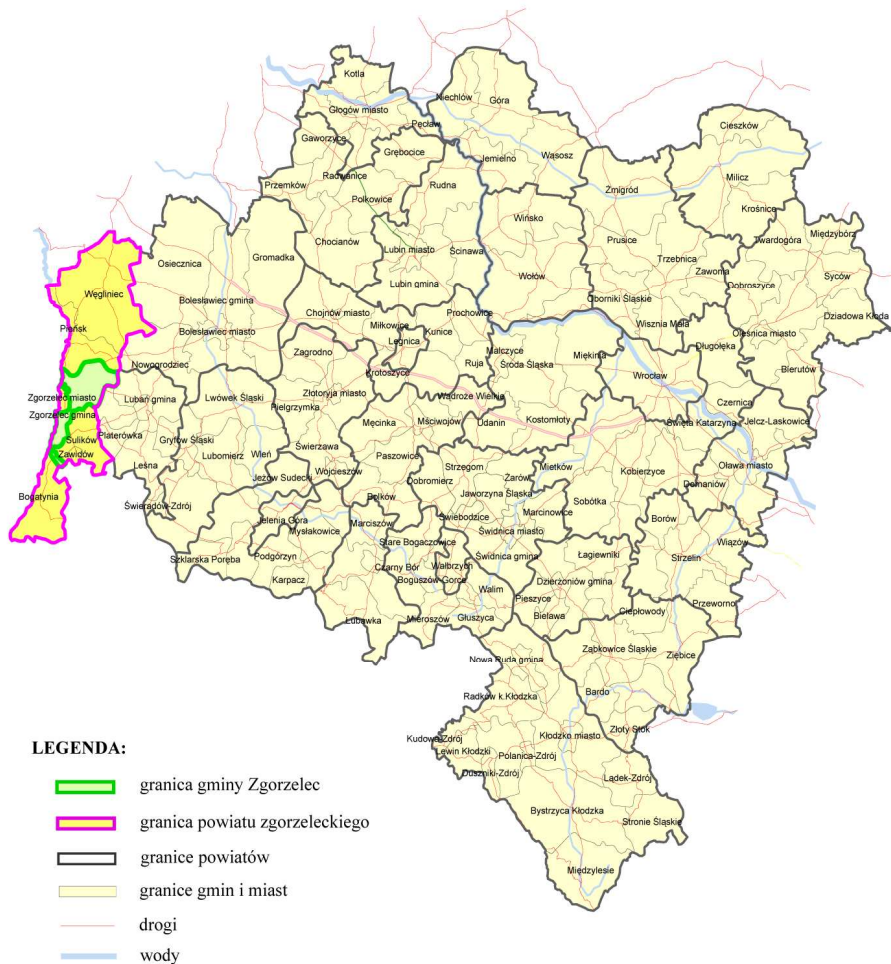
Rysunek nr 2: Położenie Gminy Zgorzelec w województwie dolnośląskim